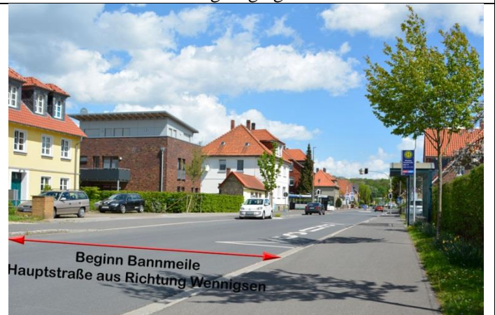
Hauptstraße aus Richtung Wennigsen kommend