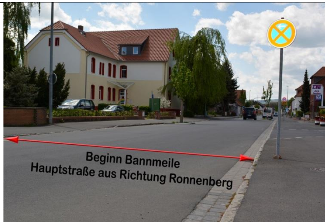
Hauptstraße aus Richtung Ronnenberg kommend