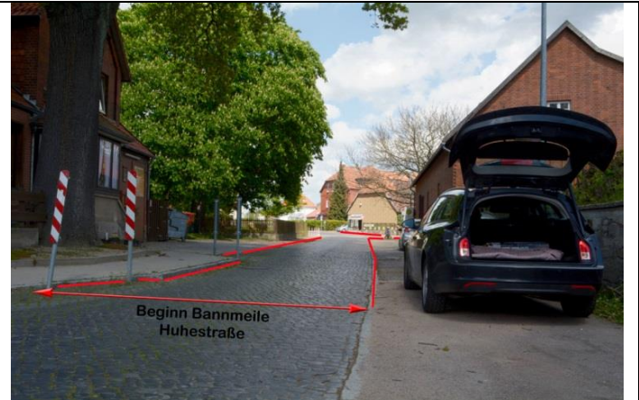
Huhestraße aus Richtung Engalgasse kommend