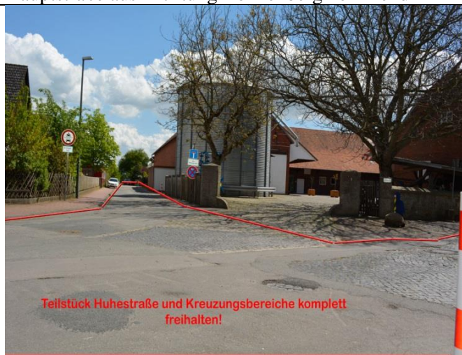
Huhestraße – Bereich Sackgasse zur Schule