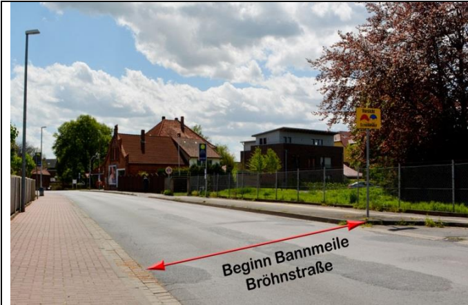
Bröhnstraße vom Bahnhof kommend